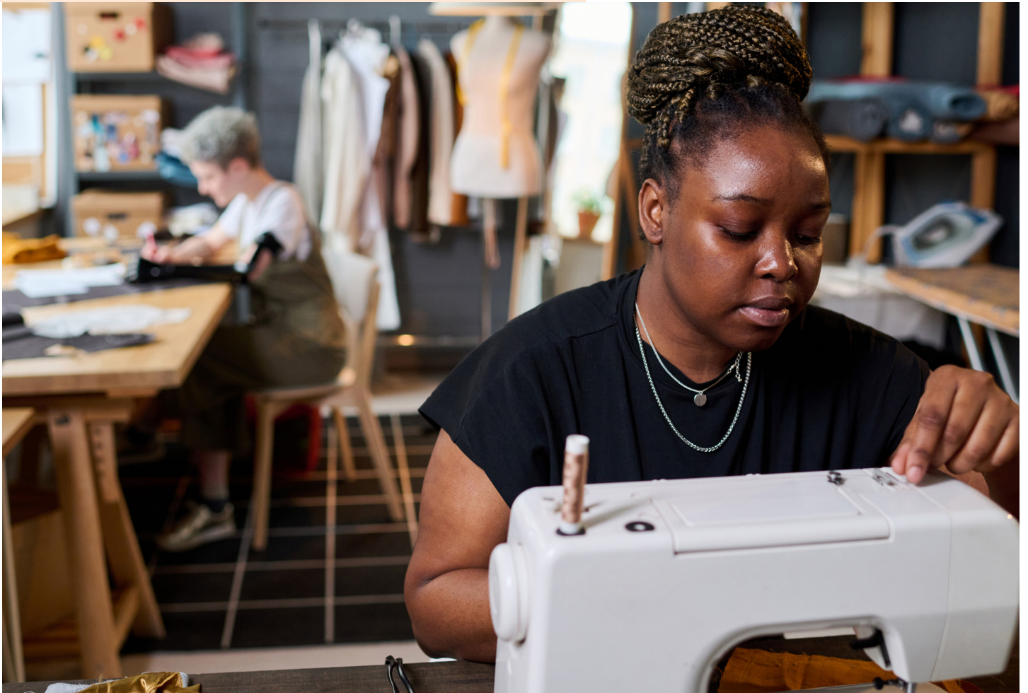
Young Women in Fashion

L'écart entre la Simulation 1 et la Simulation 2 dans le graphique ci-dessus illustre que le nombre d'emplois créés grâce à une augmentation de 10% du budget des politiques actuelles serait moindre que ceux créés en réallouant une partie de ce budget (actuel) à la création d'un programme permanent de recherche sur la problématique de l'emploi.