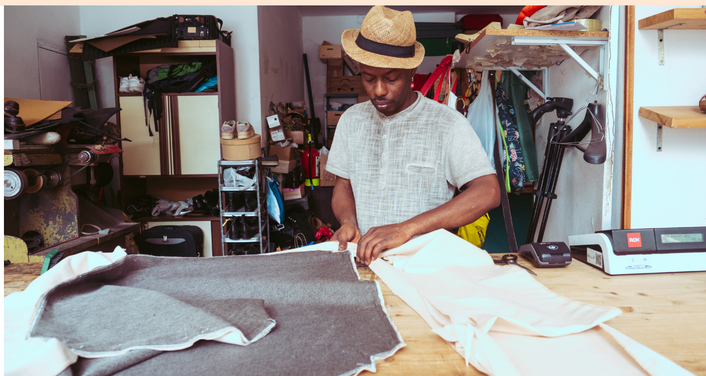
Young youth in Fashion