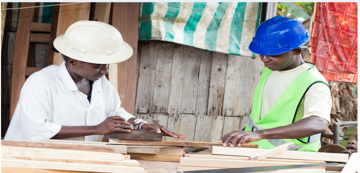
Young youths working

De même, les simulations démontrent que l'établissement d'un centre ou programme de recherche produirait les meilleurs résultats en matière d'amélioration de l'efficacité des politiques de création d'emplois pour les jeunes. En effet, cela permettrait de réduire le coût unitaire de création d'un emploi d'au moins 15%, tout en améliorant le taux d'insertion des bénéficiaires.